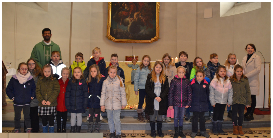
23 Kinder aus der VS Kaindorf feiern am 18. Mai ihre Erstkommunion.

Und immer mehr soll es werden, Himmel auf Erden, Stück für Stück, himmlisches Glück!