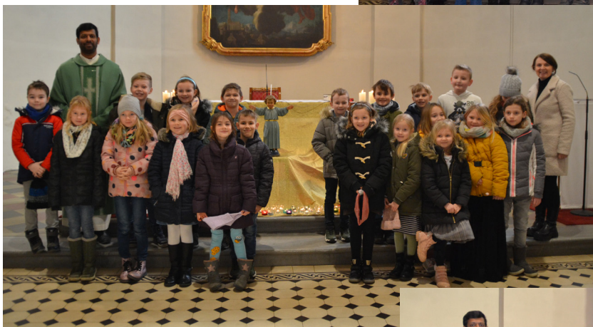
21 Kinder aus der VS Hofkirchen bereiten sich auf das Fest der Erstkommunion vor, das sie am 13. Mai feiern werden.