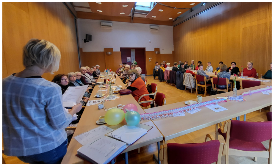
Faschingsfeier KFB Ebersdorf

Am 3. März 2024 laden wir Sie sehr herzlich zum Suppenessen nach der Sonntagsmesse ein. Die Frauen der KFB bieten köstliche Suppen zum Essen und zum Mitnehmen an und bitten um Ihre Spende für die Aktion „Familienfasttag“.